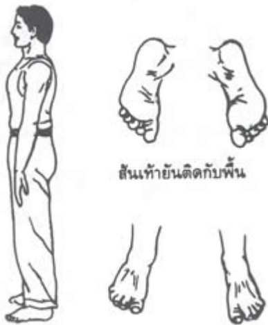
เอวเป็นแกนเพลลา นิ้วเท้าจรดกับพื้น

๒. ปล่อยมือทั้ง ๒ ข้างลงตามธรรมชาติ อย่าเกร็งให้นิ้วมือชิดกัน ให้นิ้วมือไปข้างหลัง (ดูภาพประกอบด้านล่าง)