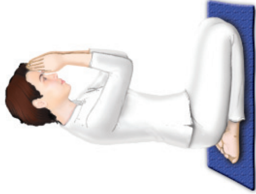
ท่านหญิง ก้มศีรษะเล็กน้อย

จังหวะที่ ๒ ‘วันทา’ ยกมือประนมขึ้นจรดหน้าผาก หัวแม่มือทั้งสองอยู่ระหว่างคิ้ว