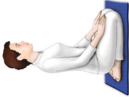
ท่านหญิง นั่งคุกเข่าราบ