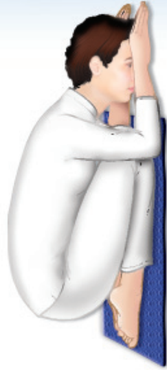
ท่านหญิง ให้ช้อนอกทั้งสองชนขา

จังหวะที่ ๓ ‘อภิวัต’ หมอบกราบลงให้หน้าผากจรดพื้น วางฝ่ามือแบราบท่างกันหนึ่งฝ่ามือ ก้มศีรษะลงให้หน้าผากจรดพื้นในระหว่างฝ่ามือทั้งสอง