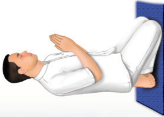
จังหวะที่ ๑ 'อัญชลี' ยกมือขึ้นประนมระหว่างอก