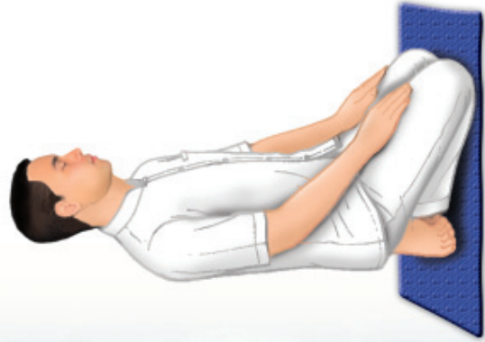
ท่านชาย นั่งคุกเข่า