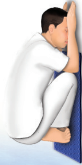
ท่านชาย ช้อนอกต่อกับหัวเข่า

จังหวะที่ ๒ ‘วันทา’ ยกมือประนมขึ้นจรดหน้าผาก หัวแม่มือทั้งสองอยู่ระหว่างคิ้ว